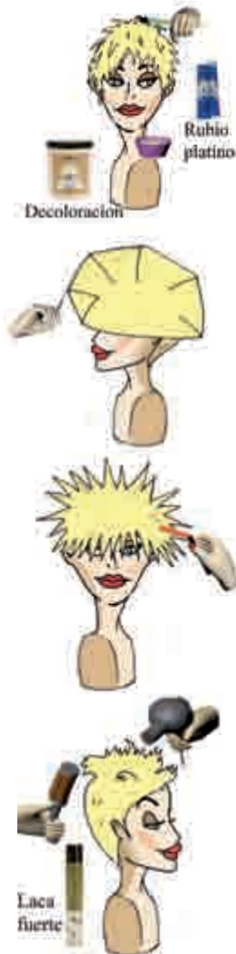
Fig.1. Se realiza una decoloración al 12%, en todo el cabello, aplicando un baño de color con un rubio platino al 3% en el mismo.