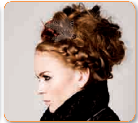
Fig.4. En la coronilla se sujeta el mismo con clips, y se rocía con la laca.