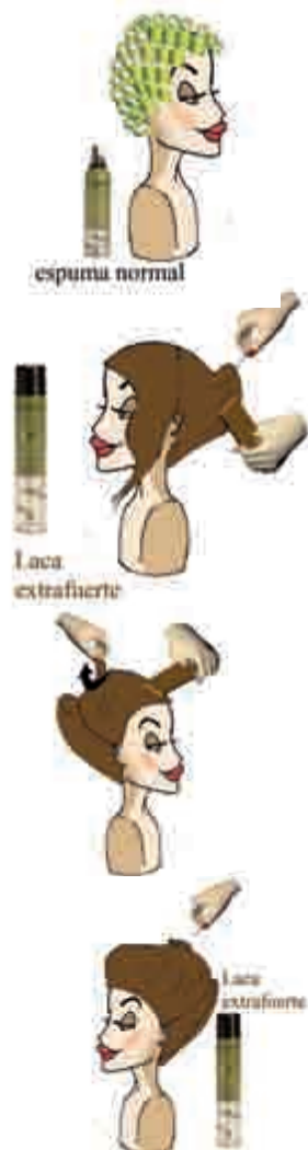
Fig.1. Utilizando espuma normal se enrolla todo el cabello en rulos grandes.