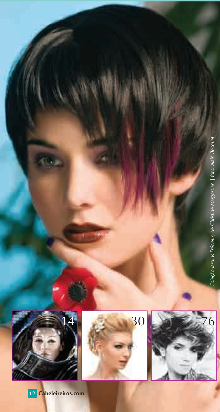
Coleção Jardins Précieux, de Christine Margossian