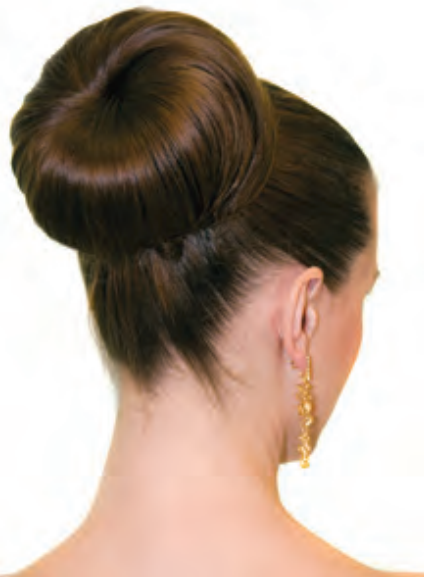
Ana Beatriz Barros (Festa da amfAR em 2011)