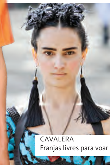
CAVALERA Franjas livres para voar