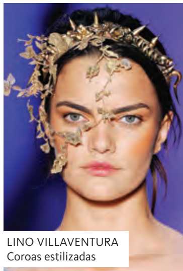
LINO VILVAVENTURA Coroas estilizadas