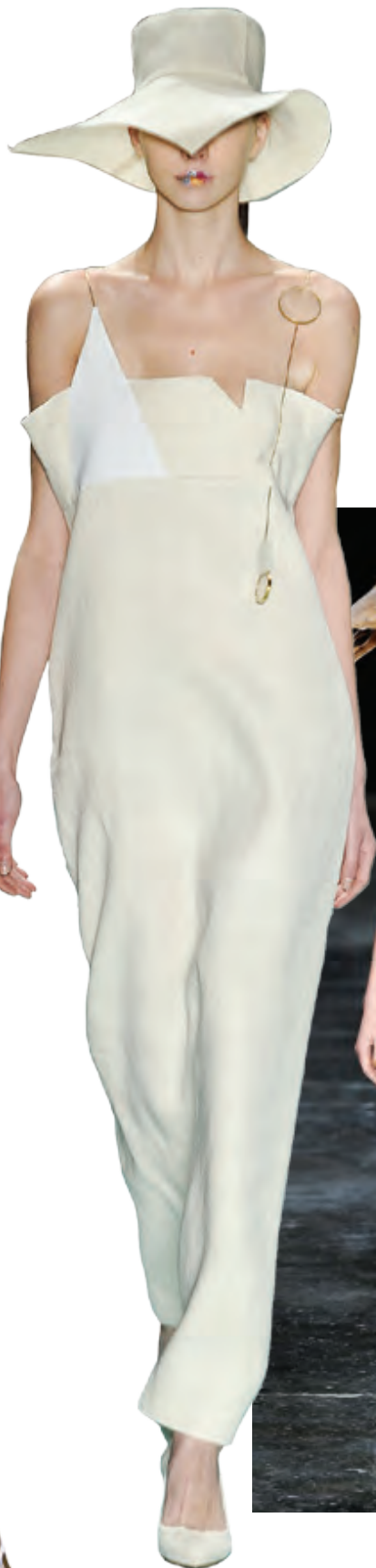
MARIA BONITA Chapéus maleáveis