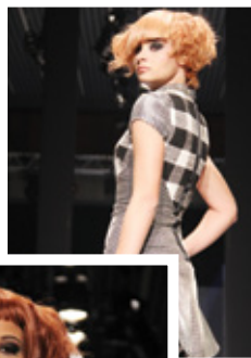
Desfile Pas de Deux