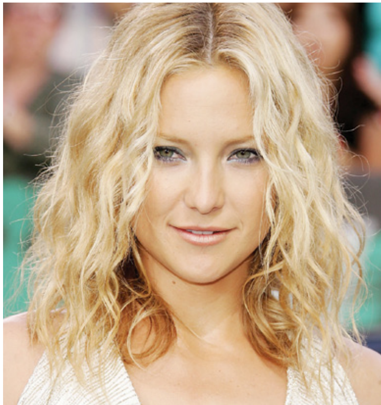
Se o problema são... Orelhas de abano