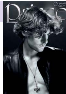
hair • KLAUS PETER OCHS artistic team • Davide Carsidona, Brigitt Härtlich, Nicol Steglich