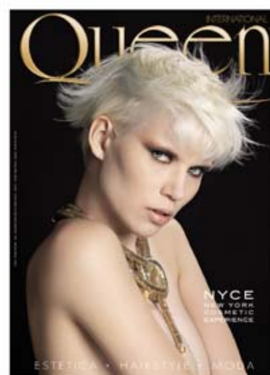
hair - Giampiero Muratore & Keith Harris colour - Paola Dalla Rosa styling - Veronica Piazza