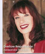
Direttore Responsabile Alessandra Pedroni