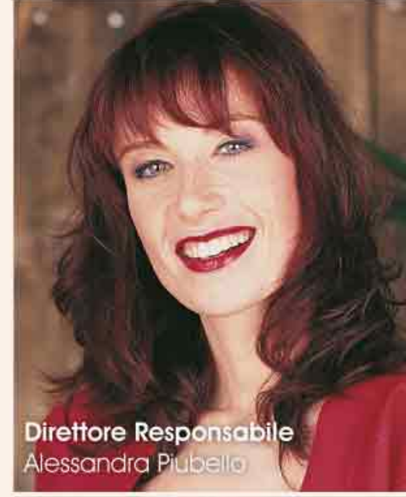
Direttore Responsabile Alessandra Piubello