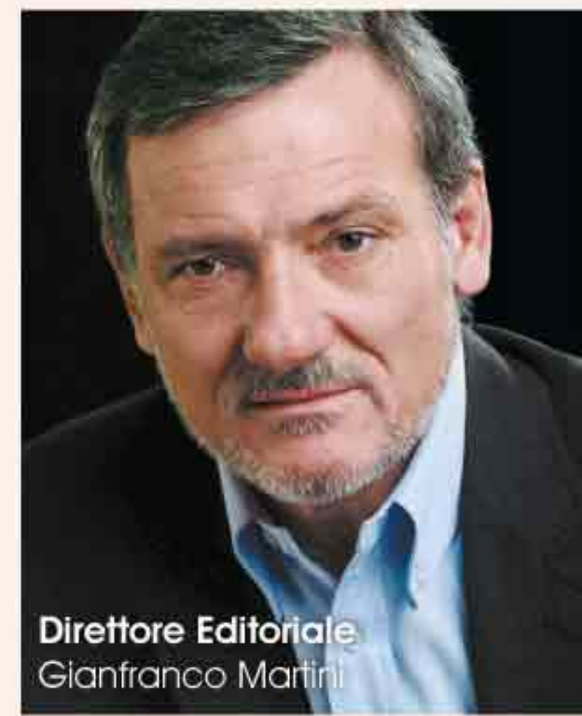
Direttore Editoriale Gianfranco Martini

La redazione non è responsabile dei testi, illustrazioni, e foto inviate e pubblicate. La sola responsabilità è degli autori. Il materiale raccolto per l'eventuale pubblicazione non sarà restituito salvo particolari accordi stipulati con autori, enti, associazioni e aziende. Le indicazioni dei marchi e degli indirizzi nelle pagine redazionali di questo numero sono a titolo d'informazione senza alcuno scopo pubblicitario. La riproduzione dei testi, disegni e fotografie pubblicate è vietata. La proprietà di essi è esclusiva del periodico QUEEN INTERNATIONAL che si riserva tutti i diritti di pubblicazione e traduzione internazionale. Printed in Italy - Tutti i diritti riservati - © QUEEN INTERNATIONAL registrato presso il Tribunale di Verona Autorizzazione n. 1085 del 23/04/1993. Spedizione in abbonamento postale C. 26 - Art. 2 L. 549/95 - da San Martino B/A. IVA a carico dell'editore non detraibile dall'abbonamento ai sensi del D.M. 28/12/72 art. 1 comma 1 e successive modifiche. La ricevuta di pagamento del CCP è documento idoneo e sufficiente ad ogni effetto contabile e pertanto non si rilasciano altri documenti.