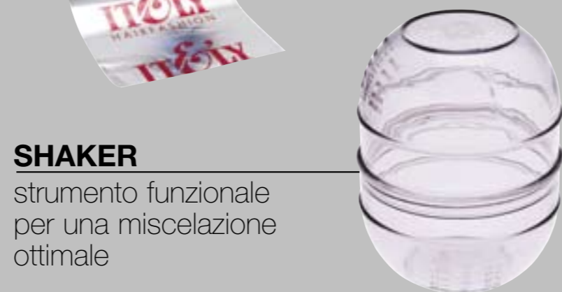
SHAKER strumento funzionale per una miscelazione ottimale