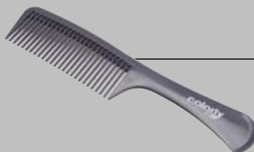
PETTINE a denti larghi