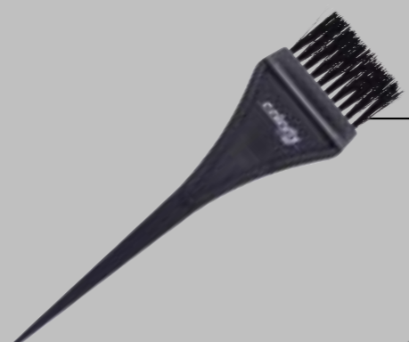
PENNELLESA con setola zigrinata