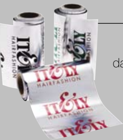
KIT ALLUMINIO pratico kit composto da 3 rotoli da 40 metri da inserire nel Color Trolley