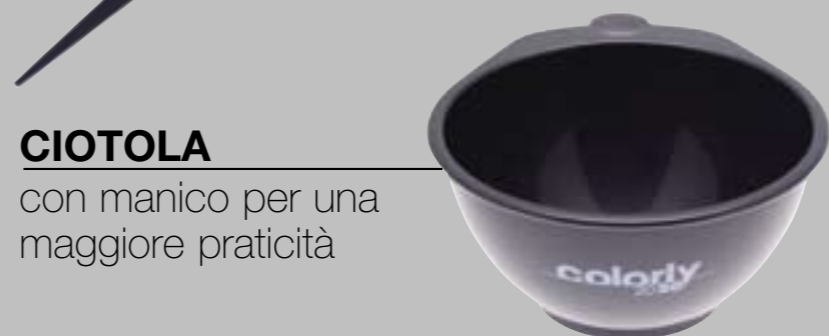
CIOTOLA con manico per una maggiore praticità