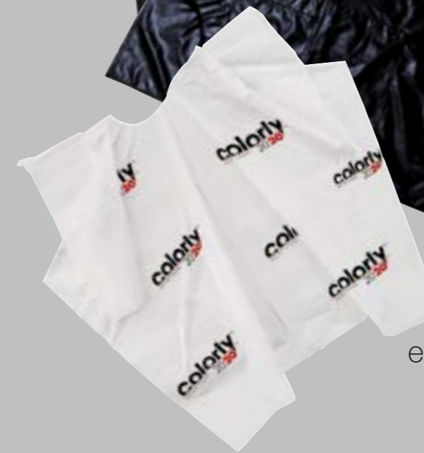
PETTORINA pratico grembiule salva-macchia per tecnici coloristi