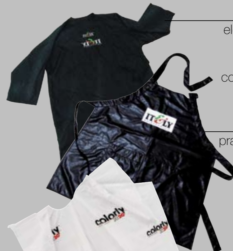
KIMONO elegante kimono anti-macchia per la cliente con logo bifronte